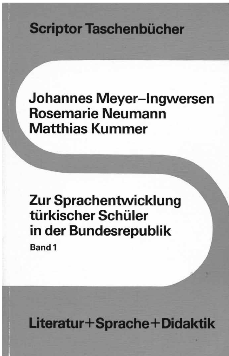
(3) Wichtige Publikation zu Deutsch als Zweitsprache aus dem Jahr 1977.

2. Wie wird muttersprachliches und zweitsprachliches Lernen curricular umgesetzt? Dabei ist offensichtlich, dass die curriculare Organisation eigentlich in Abhängigkeit von der Antwort auf die erste, entwicklungspsychologische Frage vorgenommen werden müsste.