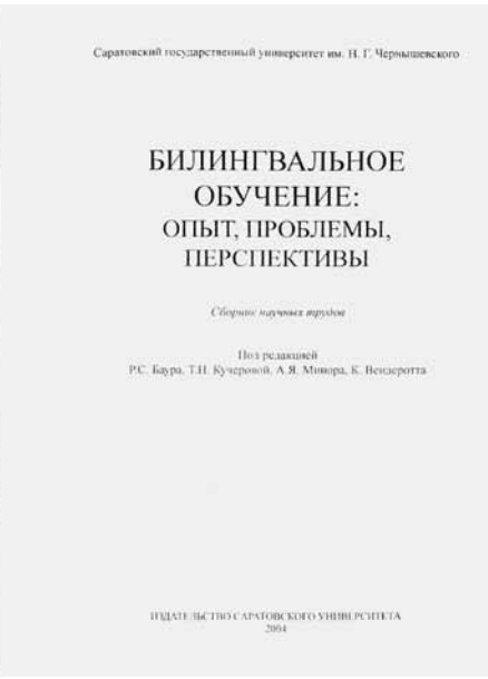
(2) Erste in Russland erschienene Buchpublikation zum biligualen Sachfachunterricht.

der Zweitsprache Deutsch. Während im schulischen Fremdsprachenunterricht (DaF im Ausland) in der Regel altersgemäße Muttersprachenkenntnisse vorausgesetzt werden können, auf die bei Erklärungen auch im Fremdsprachenunterricht bei Bedarf zurückgegriffen werden kann, müssen im Unterricht DaZ mit Kindern von Migrantinnen und Migranten besondere Maßnahmen ergriffen werden, um muttersprachliche und zweitsprachliche Entwicklung aufeinander zu beziehen.