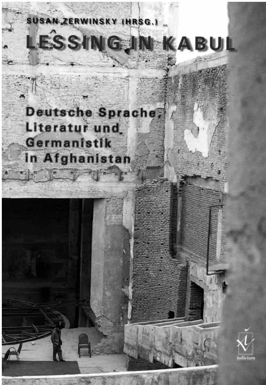
(8) Publikation zum Wiederaufbau der Germanistik in Kabul (2008). Darin auch ein Beitrag von Rupprecht S. Baur, Ramona Karatas und Markus Hülbusch (s. Literaturverzeichnis).

tenzen von Studierenden ermittelt werden kann. Es wird daran gearbeitet, entsprechende Tests mit automatischer Auswertung online zur Verfügung zu stellen. Auf der Basis der Testergebnisse soll eine differenzierte Beratung der Studierenden und die Entwicklung eines individuellen Konzepts zur Beseitigung der sprachlichen Defizite ermöglicht werden. Die Testergebnisse können ebenfalls die Entwicklung entsprechender Angebote beispielsweise in den Schreibwerk-