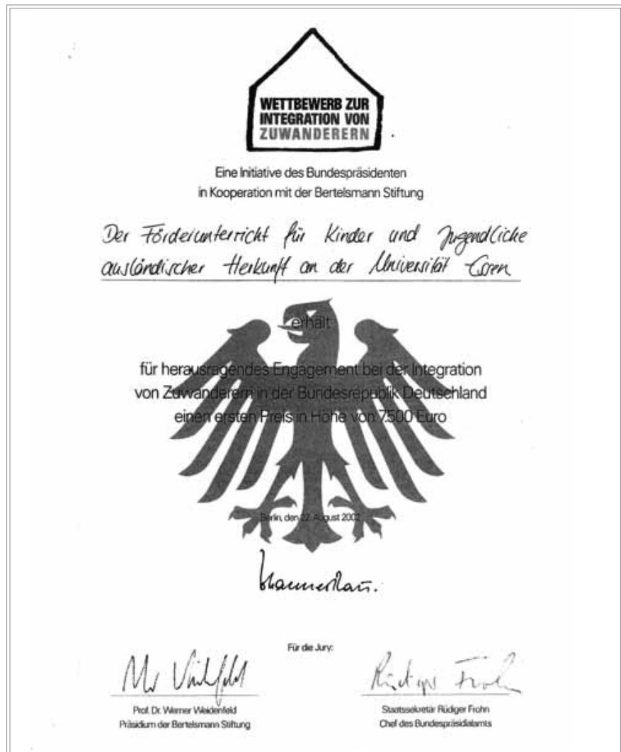
(6) Urkunde zum Förderunterricht aus dem Jahr 2002.

In dem Projekt Sprache durch Kunst werden Kinder und Jugendli-