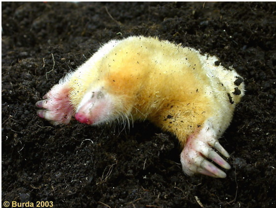
Körperhaltung rekonstruiert/Posture reconstructed

Schmitt, M., Pospiech, J., Burda, H. (2006): Der bemerkenswerte Fund eines goldfarbenen Maulwurfweibchens ( Talpa europaea ) aus Hattingen (Westfalen). Natur u. Heimat, 66(2): 59-61.