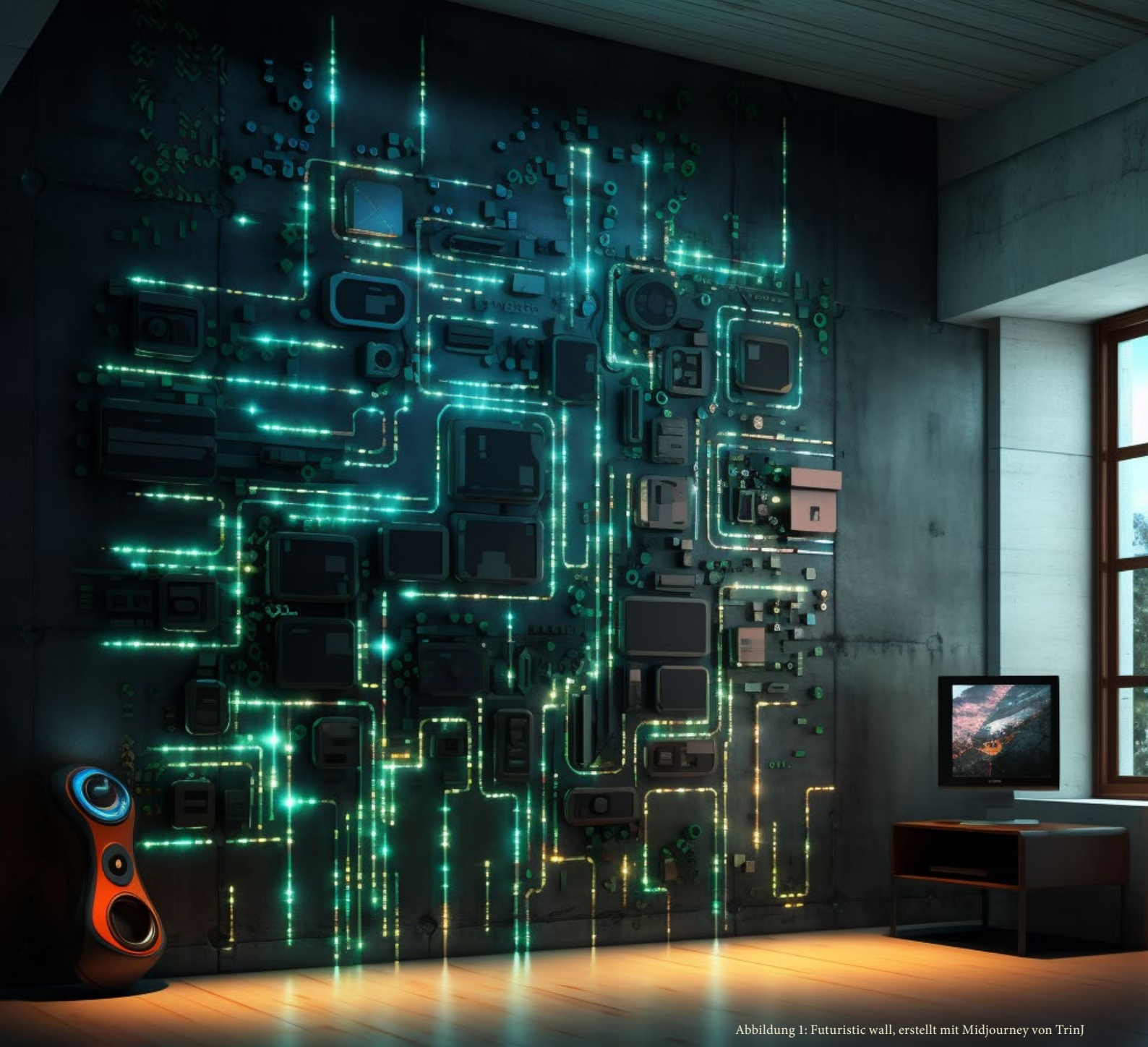
Abbildung 1: Futuristic wall, erstellt mit Midjourney von TrinJ