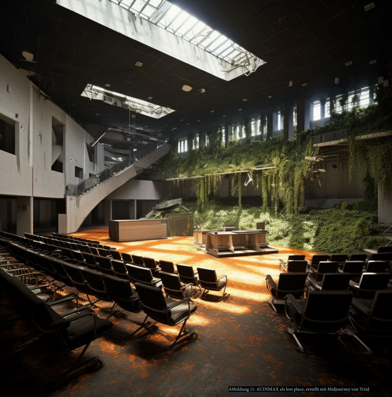
Abbildung 11: AUDIMAX als lost place, erstellt mit Midjourney von TrinJ