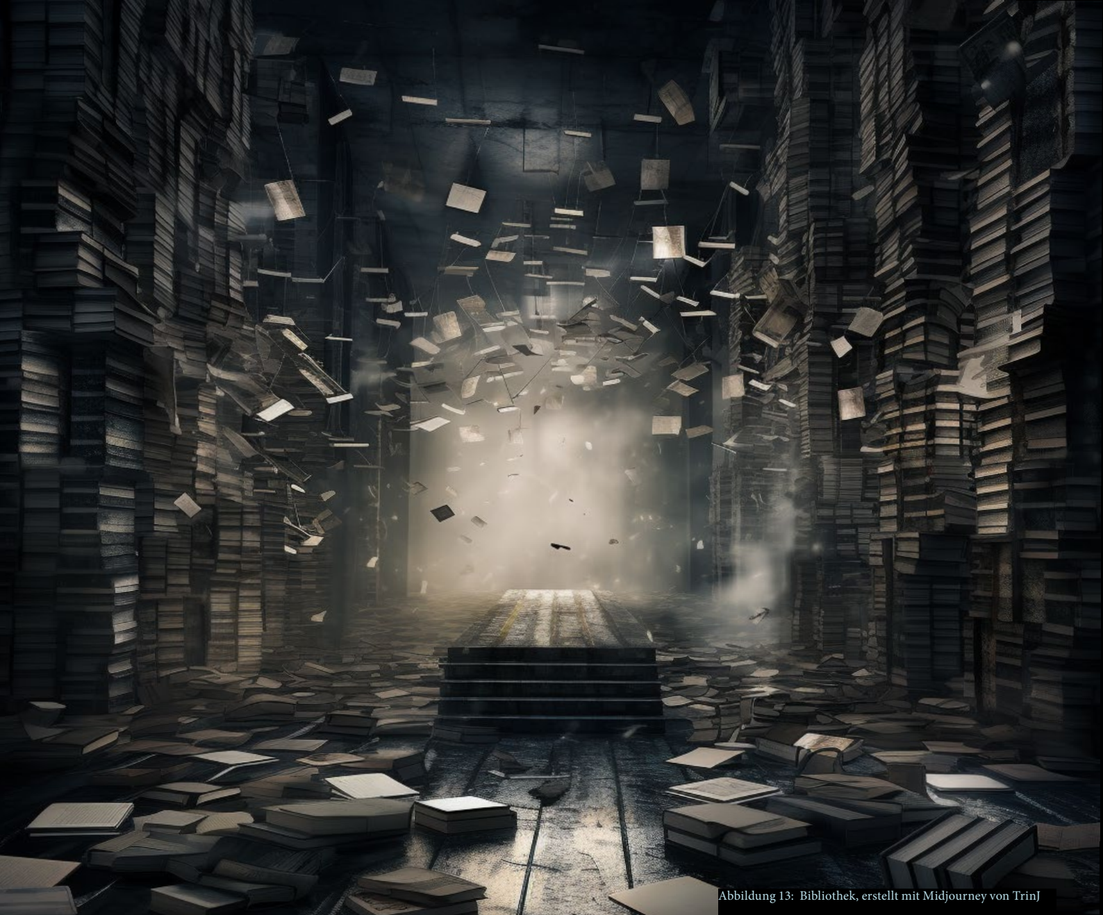
Abbildung 13: Bibliothek, erstellt mit Midjourney von TrinJ