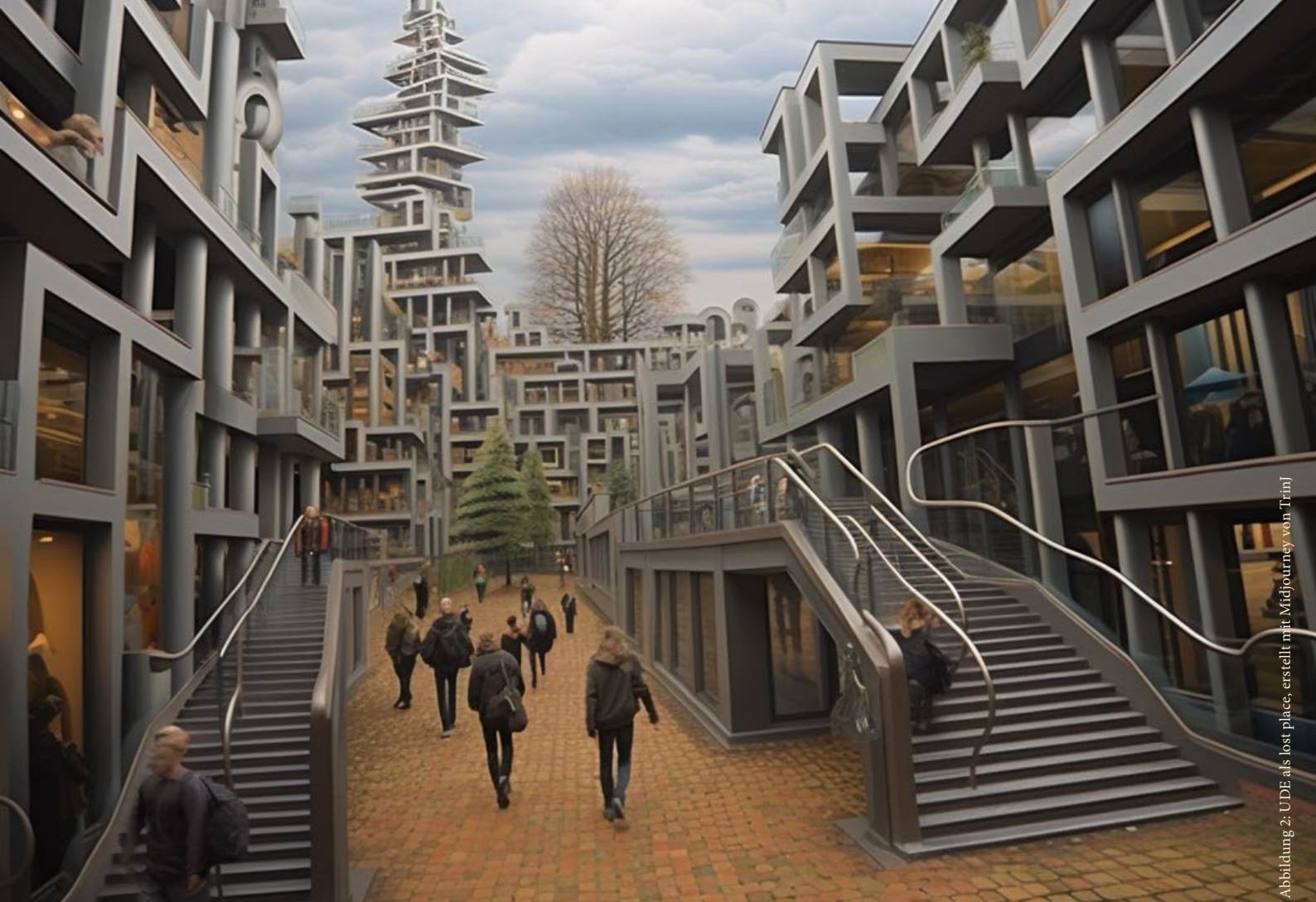
Abbildung 2: UDE as lost place, erstellt mit Midjourney von Trini