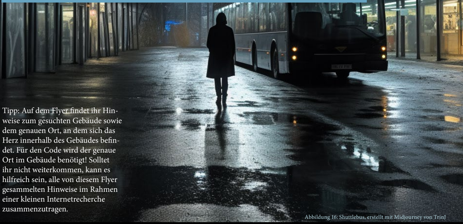
Abbildung 16: Shuttlebus, erstellt mit Midjourney von TrinJ

Tipp: Auf dem Flyer findet ihr Hinweise zum gesuchten Gebäude sowie dem genauen Ort, an dem sich das Herz innerhalb des Gebäudes befindet. Für den Code wird der genaue Ort im Gebäude benötigt! Solltet ihr nicht weiterkommen, kann es hilfreich sein, alle von diesem Flyer gesammelten Hinweise im Rahmen einer kleinen Internetrecherche zusammenzutragen.