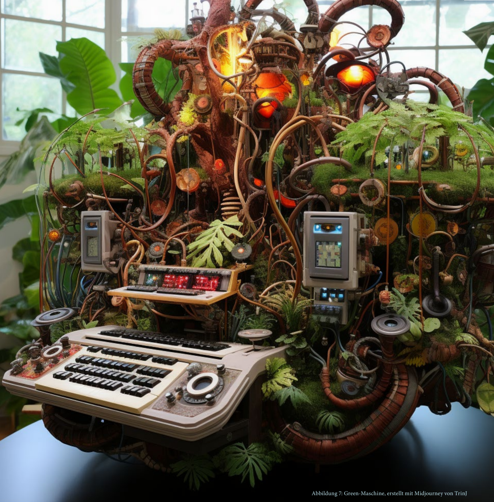
Abbildung 7: Green-Maschine, erstellt mit Midjourney von TrinJ