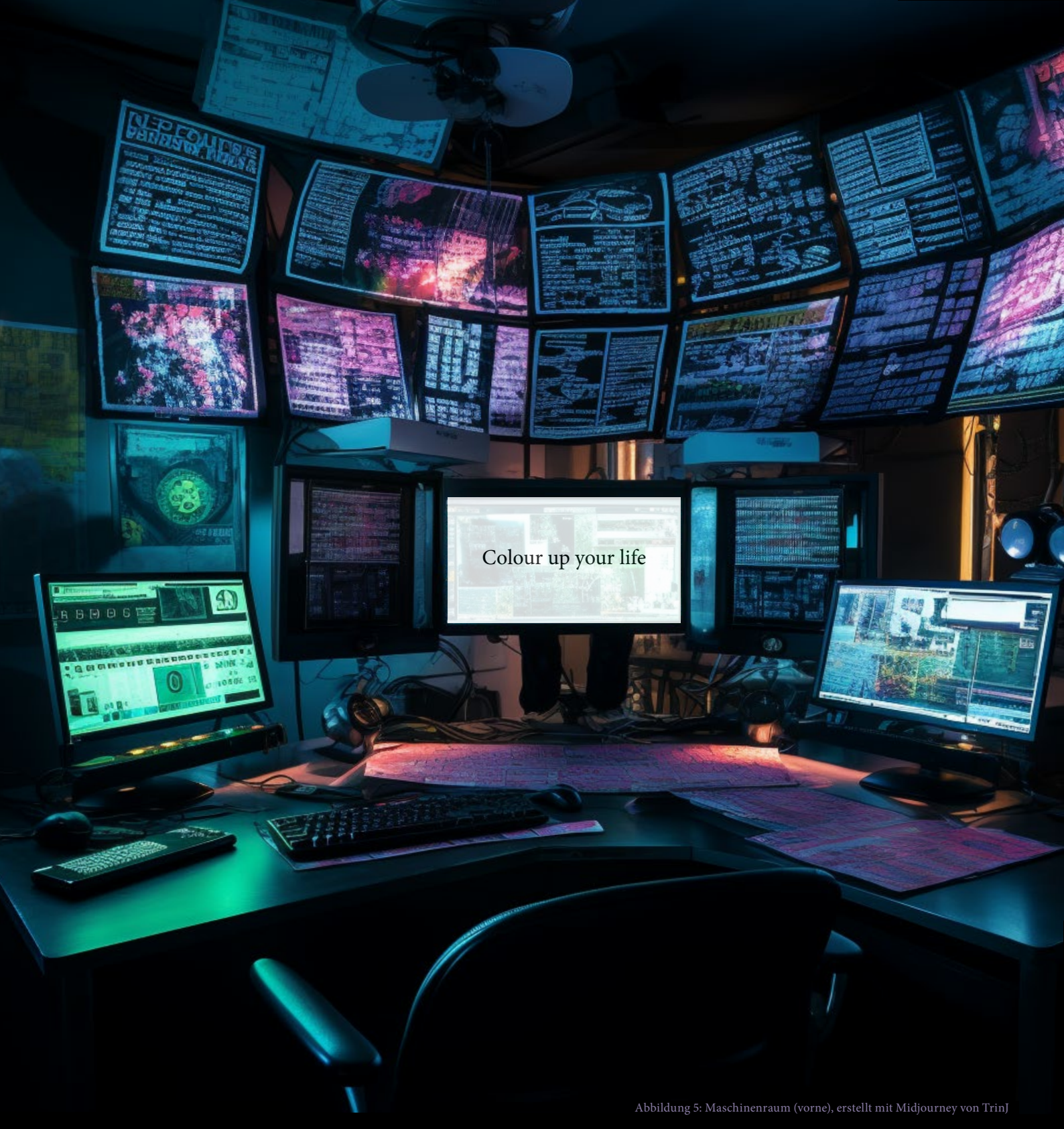
Abbildung 5: Maschinenraum (vorne), erstellt mit Midjourney von TrinJ