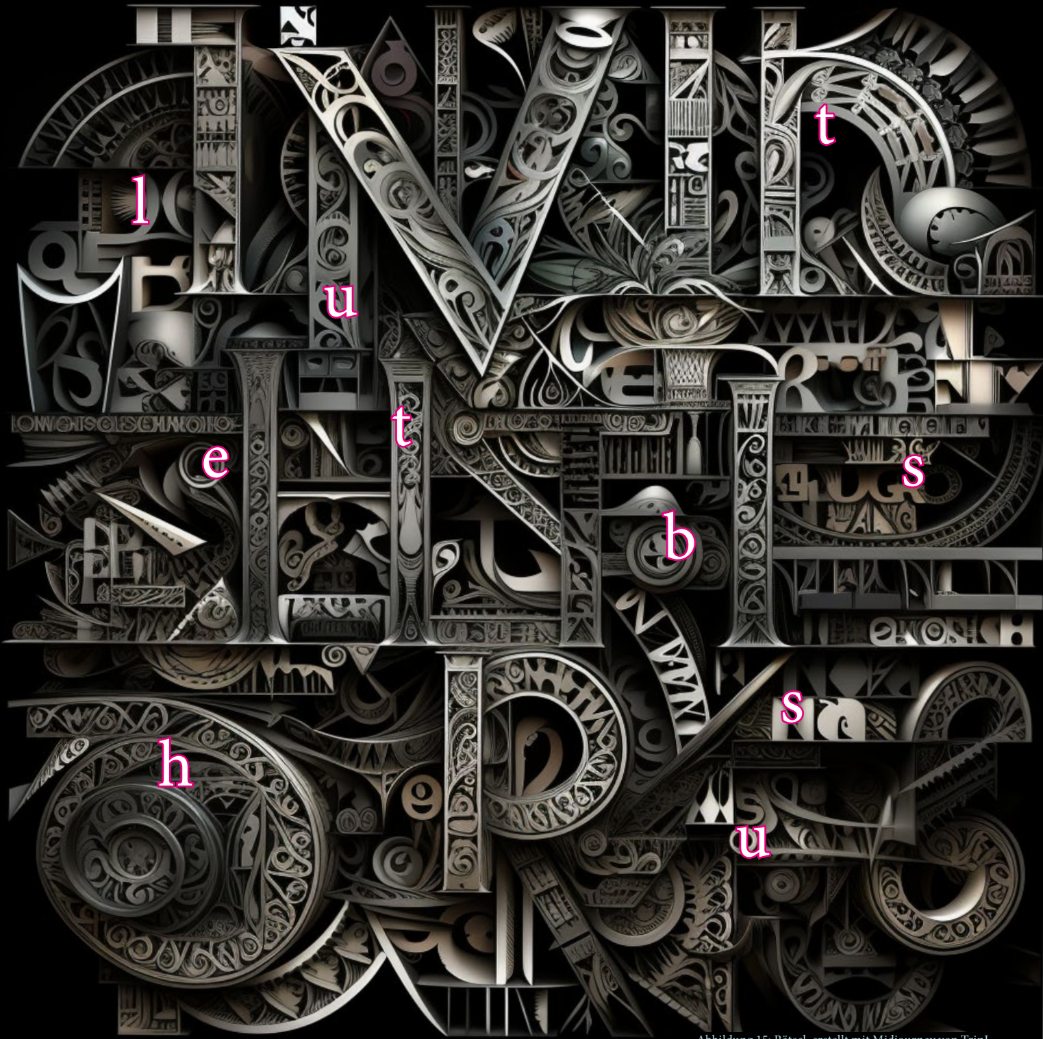
Abbildung 15: Rätsel, erstellt mit Midjourney von TrinJ