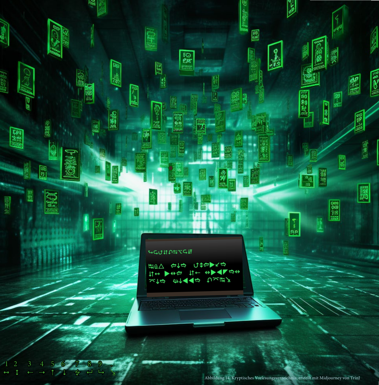
Abbildung 14: Kryptisches Vorlesungsverzeichnis, erstellt mit Midjourney von TrinJ