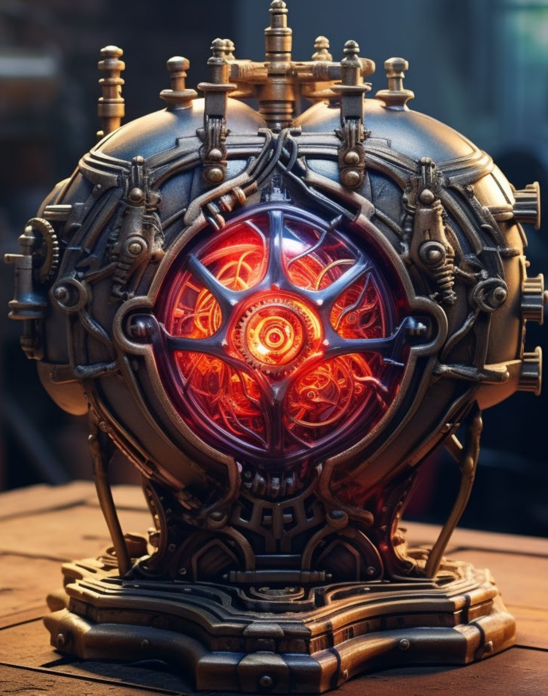
Abbildung 17: UDE-Herz, erstellt mit Midjourney von TrinJ