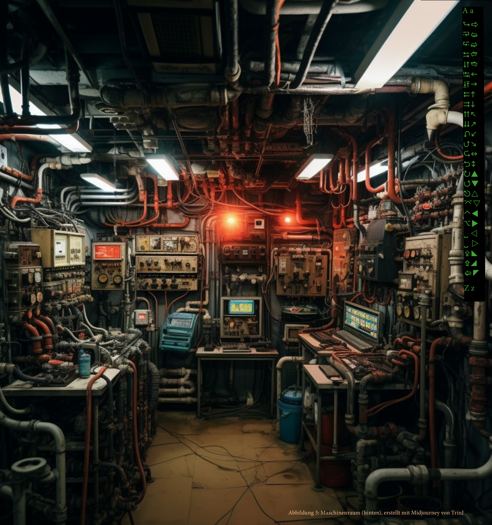
Abbildung 3: Maschinenraum (hinten), erstellt mit Midjourney von Trinj