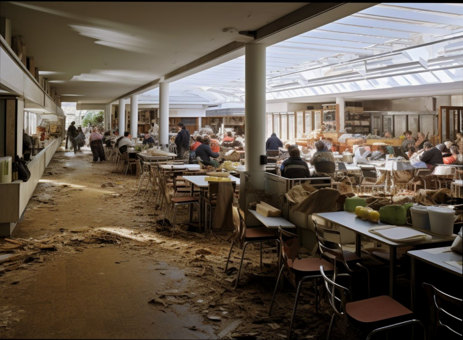
Abbildung 9: Mensa als lost place, erstellt mit Midjourney von TrinJ